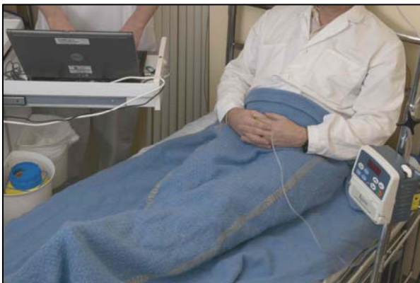
Bild 3) Det finns tekniska lösningar som medger säker användning av datorer närmare patient än 1.5 meter. Exempelvis speciellt klassade datorer, isolationstransformatorer, etc. Kontakta din lokala medicintekniska organisation för mer information.