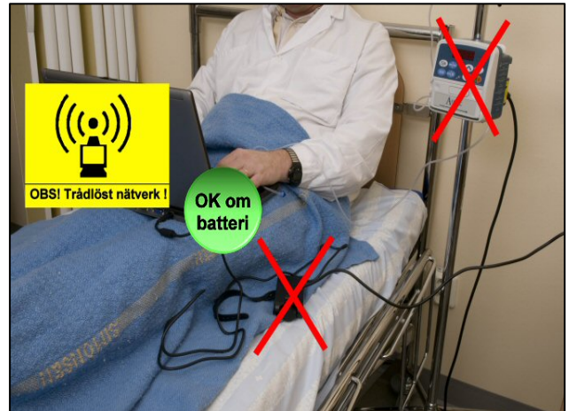
Bild 2) Om patienten INTE är ansluten till någon medicinteknisk produkt och datorn INTE heller är ansluten till elnätet, kan man använda en dator med WLAN nära patient. Detsamma gäller så kallade 3G-modem för uppkoppling mot internet.